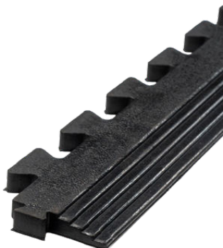
Heavy Interlock oplooprofiel

Deze tegel is perfect geschikt voor commerciële gyms, PT Studio's, functional training, en nog veel meer andere toepassingen.