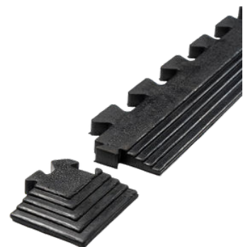
Heavy Interlock hoekprofiel